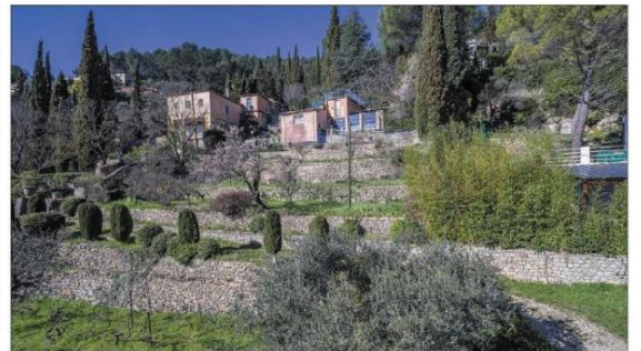
Le projet de restauration, lauréat du fonds de soutien aux métiers d'art, devrait permettre de refaire les mythiques restanques.

La commune va ainsi bénéficier d'une dotation de 30 000 euros, la première de la région Sud, pour aider à la restauration des restanques du jardin, qui donnent leur autre tout son cachet extérieur à la villa Mentor. « Il y a un an je me suis battu auprès du syndicat mixte du bassin versant du Gapain pour obtenir, sur un côté de la propriété, de gros travaux à hauteur de 100 000 euros pour rénover les restanques à l'ancienne, explique le maire Jérôme Fabre. Pourquoi ? Parce qu'au-delà de l'aspect patrimonial de ce lieu, situé juste au-dessus de la place de l'église, il y avait, aussi, un intérêt de gestion des eaux de ruissellement ».