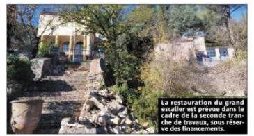
La restauration du grand escalier est prévue dans le cadre de la seconde tranche de travaux, sous réserve des financements.

sculptures de l'artiste appartiennent à un fonds de dotation, « qui en a la charge », rappelle le maire. Si musée il y a, cela ne sera pas sur la commune, qui reconnaît « ne pas avoir de foncier disponible », ni « dans la maison qui, au regard de nombreux objets présents, ne s'y prête pas ». Mais nul doute que les projets ne manqueront pas pour mettre, une fois encore, dans la lumière l'œuvre de cet artiste.