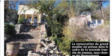
La restauration du grand escalier est prévue dans le cadre de la seconde tranche de travaux, sous réserve des financements.

sculptures de l'artiste appartiennent à un fonds de dotation, « qui en a la charge », rappelle le maire. Si musée il y a, cela ne sera pas sur la commune, qui reconnaît « ne pas avoir de foncier disponible », ni « dans la maison qui, au regard de nombreux objets présents, ne s'y prête pas ». Mais nul doute que les projets ne manqueront pas pour mettre, une fois encore, dans la lumière l'œuvre de cet artiste.