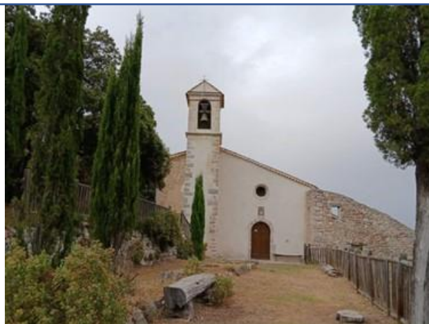
The chapelle of Notre Dame de Beauvoir in Montferrat.

This day was very interesting because of the links that were created between the various Var associations and the many exchanges on the projects of each one.