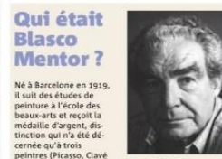
Blasco-Mentor. ses créations. Chevalier des Arts et Lettres, il voit son œuvre présentée dans le monde entier et décide à la fin de sa vie de faire don de sa maison et de ses œuvres qu'elle contient à la commune de Solliès-Toucas. Il décède en mai 2003.

L'affaire doit être examinée par le tribunal judiciaire de Marseille le 24 février. Un premier rendez-vous devant la justice avant que ne soit jugée la demande de nullité de la donation. P.-H.C.