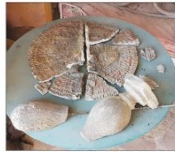
Univers Mentor présente d'innombrables clichés de la dégradation de certaines œuvres du maître.

Le fonds de dotation Univers Mentor lance une procédure contre la mairie de Solliès-Toucas. Elle lui reproche de ne pas assumer ses responsabilités dans la conservation de l'œuvre de l'artiste.