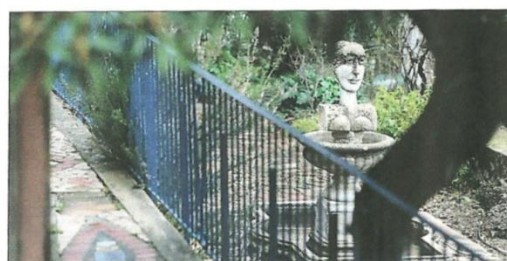
Le fonds Univers Mentor considère que la préservation des œuvres de l'artiste.

Rien ne va plus entre le fonds de dotation Univers Mentor – chargé « d'assurer la pérennité de l'œuvre » de Blasco Mentor (1919-2003) – et la commune de Solliès-Toucas où l'artiste espagnol avait bâti sa maison-atelier baptisée Casa Niévès. La commune a hérité – sous conditions – de cette propriété à la mort de Niévès Blasco-Martel, la veuve de Mentor. La mairie considère que les tableaux et autres sculptures qui s'y trouvent ont été légués à Univers Mentor. Le fonds de dotation, qui a saisi la justice dans des procédures distinctes, ne revendique qu'un « droit moral » sur ces objets d'art. La Ville a saisi le juge des référés du tribunal administratif de Toulon afin de contraindre Univers Mentor de débarrasser sous quinze jours la Casa Niévès, mais aussi les locaux de la mairie, des œuvres de Mentor. L'audience s'est tenue ce mercredi.